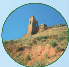
Sarroca de Lleida